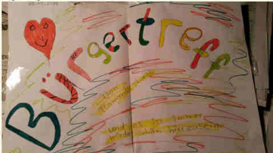
Die Zeichnung stammt von Mara Cecilia.

Vorerst zum letzten Mal wurde im Bürgerhaus Flammersbacher Straße 31 der Bürgertreff veranstaltet. Unser Vorstand sucht nun nach mittel- bis längerfristigen Alternativen.