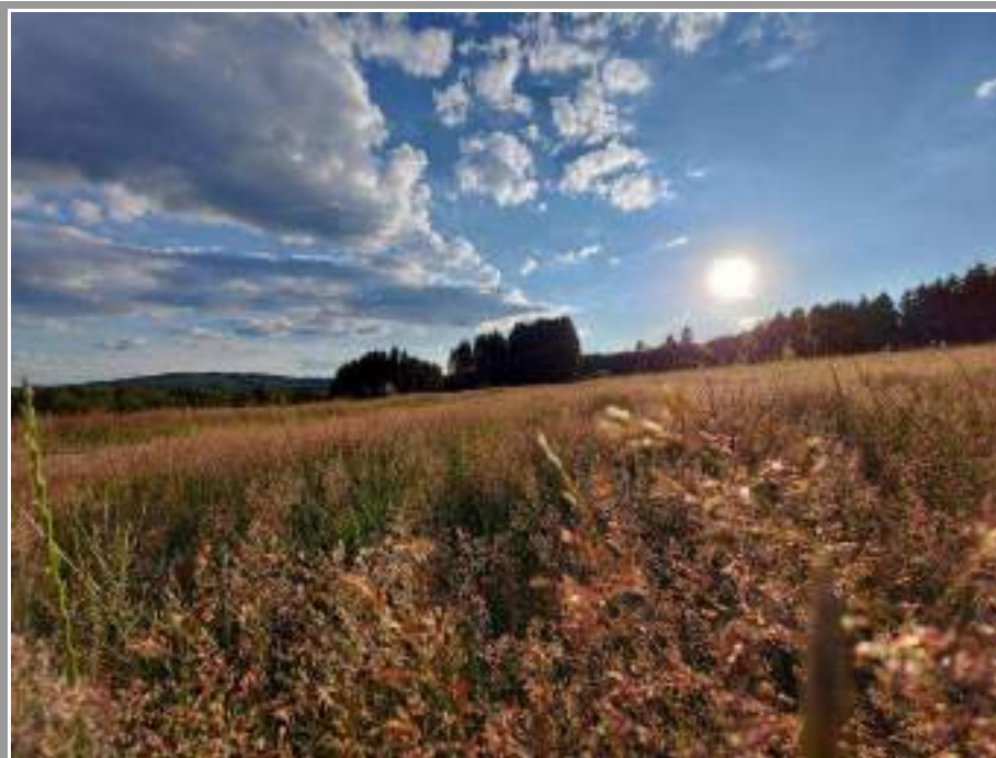
Impressionen: Filsbach 7/2020