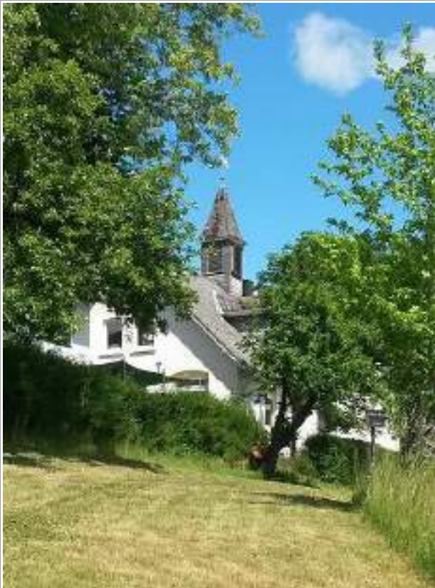
Unsere Alte Schule im Juni. Unser Daheim.