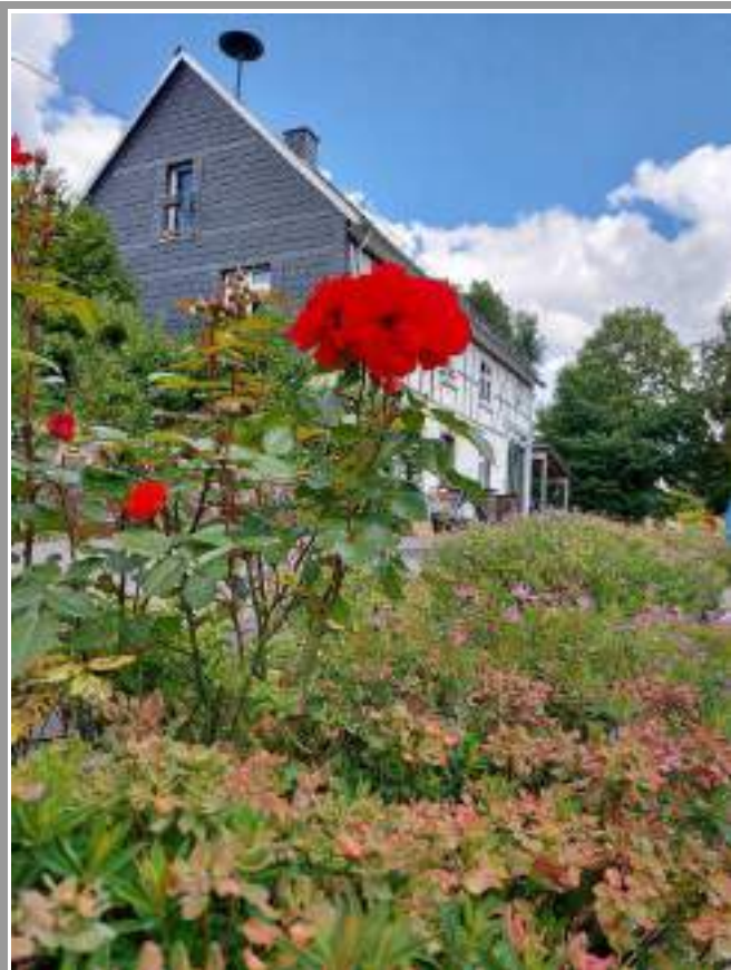
Impressionen Bullewar 7/2020

Wie bereits unten angesprochen, wurde dabei auch unsere Sitzecke unter den Linden berücksichtigt, bei der Luis und Torben die ausführenden Hände waren. Insofern haben sie ebenso und maßgeblich für den Erfolg beigetragen.