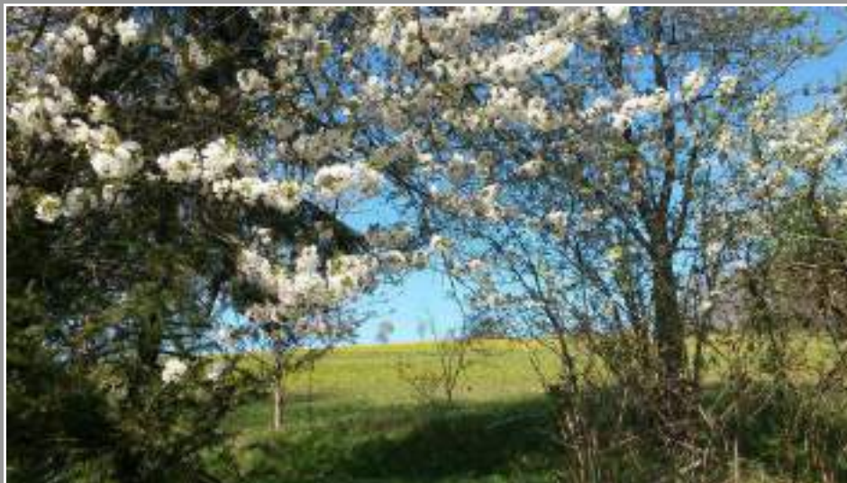
Frühling in Richtung Hundsberg