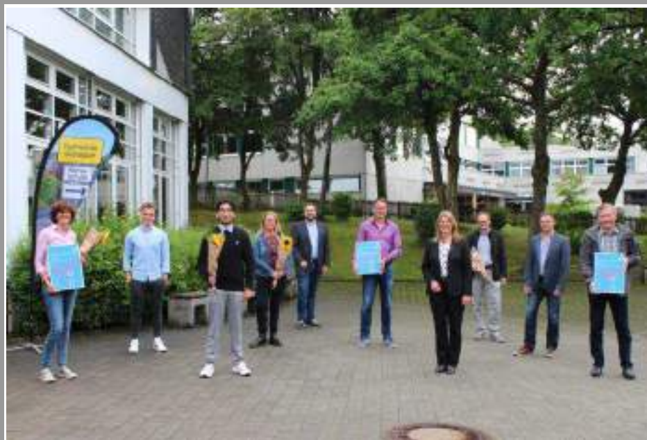
Die Gemeinde Wilnsdorf und der Energieversorger innogy zeichneten kürzlich drei vorbildliche Akteure und ihre Projekte mit dem Klimaschutzpreis 2020 aus.

Der zweite Platz ging an den Bürgerverein Flammersbach e.V., der durch die Installation eines Holzhybridofens für Pellets und Scheitholz den Energieverbrauch des vereinseigenen Bürgerhauses deutlich senken konnte. PM der Gemeinde Wilnsdorf vom 02.07.2020